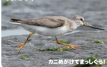
カニめがけてまっくら!