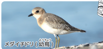
メダイチドリ(幼鳥)