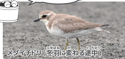
メダイチドリ(冬羽に変わる途中)