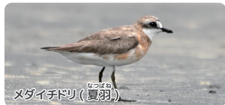
メダイチドリ(夏羽)